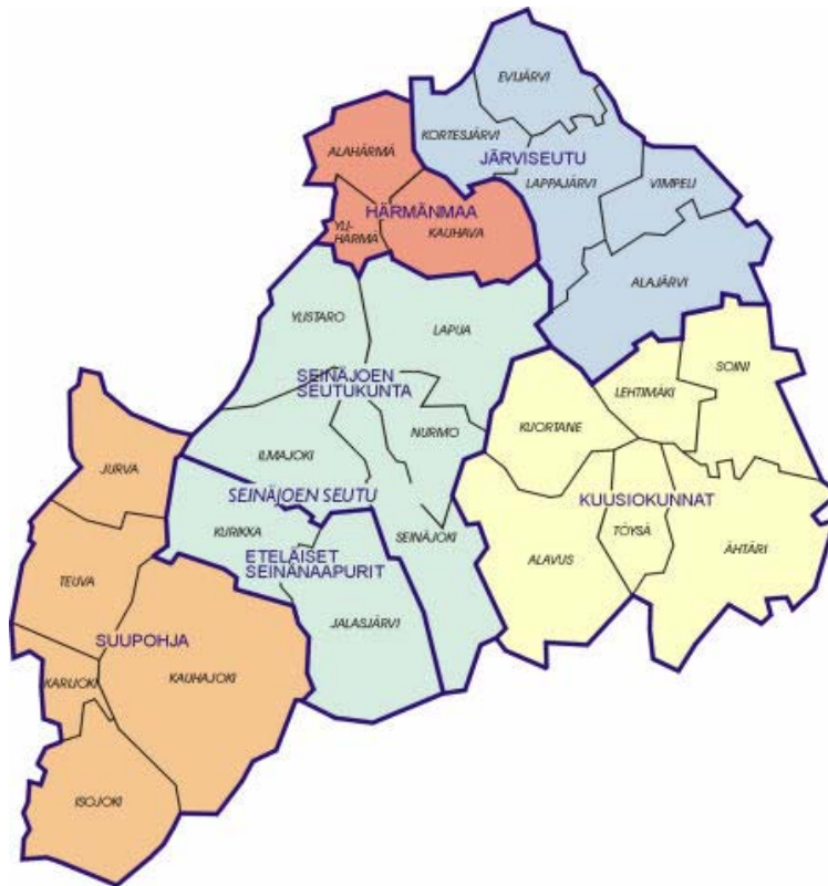
Kuva 2. Etelä-Pohjanmaan maakunta vuonna 2007