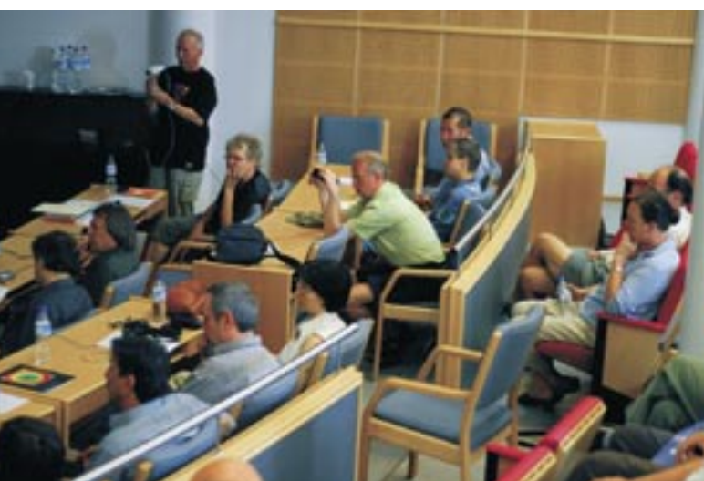
Lehtimäellä järjestettiin kansainvälinen taidesymposium kesällä 2006. Symposiumin tilaisuudet tulkattiin ja esitettiin suorana internetissä.

Etelä-Pohjanmaan kulttuurin kansainvälistymisohjelma on laadittu lähivuosien kansainvälistymistoiminnan suuntaa-antavaksi ohjeksi, jota toteuttavat alueen kuntien, yritysten, oppilaitosten, muiden julkisten organisaatioiden sekä yhdistysten ja järjestöjen hankkeet ja toimenpiteet.