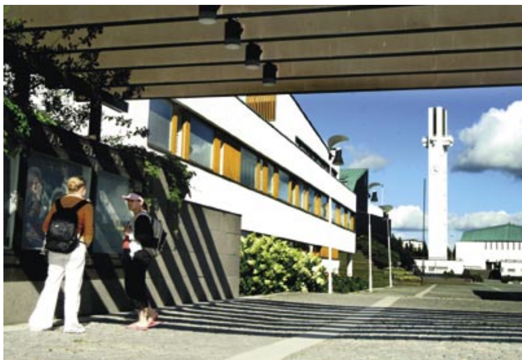
Aalto-keskus Seinäjoella on Etelä-Pohjanmaan kansainvälisesti tunnetuimpia kohteita.

Valtiosta toiseen siirtyvien ihmisten kotoutuminen uuteen kotimaahan kestää vuosia. Maakunnan toimijoiden on ryhdyttävä sektorirajat ylittävään yhteistyöhön kotouttamispolitiikkaansa kehittääkseen ja houkutellakseen alueelle niin uusia kansalaisia kuin matkailijoitakin. Panostaminen monikulttuurisen osaamiseen, suvaitsevaisuuskasvatukseen, avoimen ja vastaanottavaisen asenteen omaksumiseen helpottaa niin tulijoita kuin vastaanottajia. Kohdemaakunnan kulttuuri-