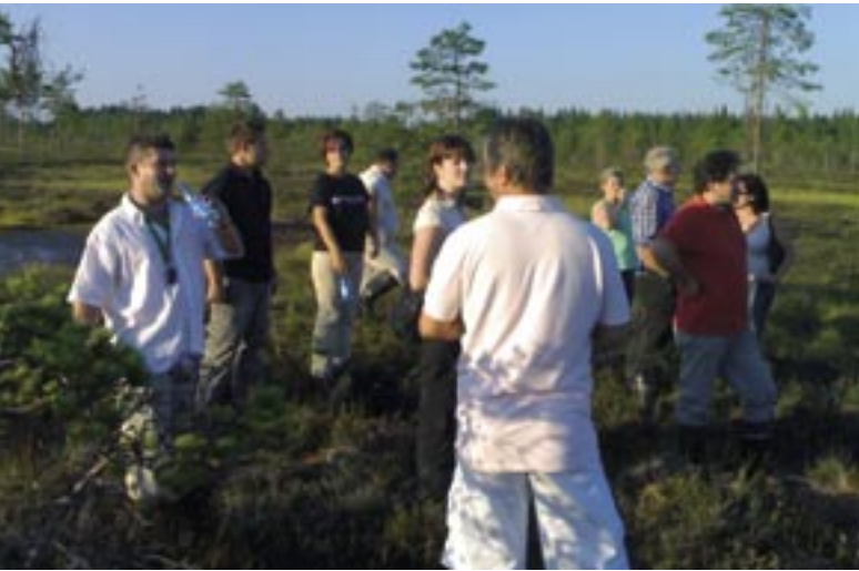
Seinäjoen ystävyyskaupunkien edustajat Orvietosta Italiasta, Sopronista Unkarista ja Koszalinista Puolasta tutustuivat suomalaiseseen luontoon kuumana kesäpäivänä vuonna 2006.

ripalvelut ja -toiminnot edesauttavat maahanmuuttajien kotoutumista ja luovat eri kulttuureja edustaville luontevia kohtaamistilanteita.