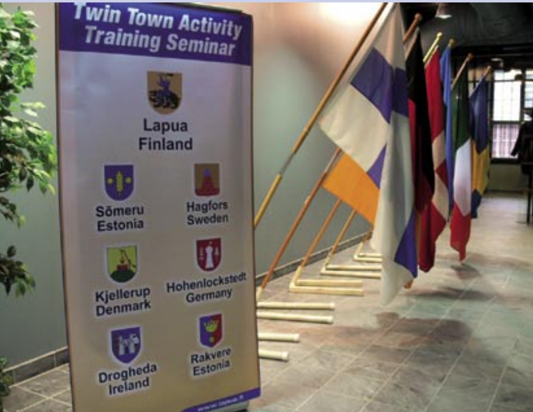
Lapua järjesti yhteistapaamisen eurooppalaisille ystävyyskaupungeilleen syksyllä 2006.

Ystävyysseurojen suunnitelmissa on suhteiden kehittäminen kohdemaan yhteistyökumppaneihin ja mm. Suomi-Puola -yhdistyksellä oppilasvaihdon tukeminen. Pohjola-Norden jatkaa Ystävyyden penkki -projektia.