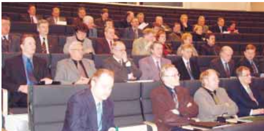
Etelä-Pohjanmaan kuntajohto kokoontuu säännöllisesti neuvottelutilaisuuksiin Etelä-Pohjanmaan liiton työntekijöiden ja luottamushenkilöiden kanssa.