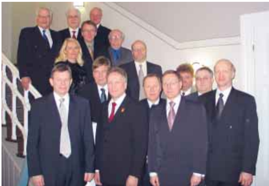
WFA:n puheenjohtajisto tapasi helmikuussa Virroilla 10-vuotisjuhlien merkeissä.

Länsi-Suomen Allianssi (WFA, West Finland Alliance) on Etelä-Pohjanmaan, Keski-Suomen, Pirkanmaan, Pohjanmaan, ja Satakunnan maakunnan liittojen strateginen yhteistyöelin. Länsi-Suomen allianssin toiminnan aloittamisen 10-vuotisjuhlaa vietettiin helmikuussa Virroilla. Lokakuussa ovat edessä juhlallisuuudet Brysselissä Eurooppa-toimistossa.